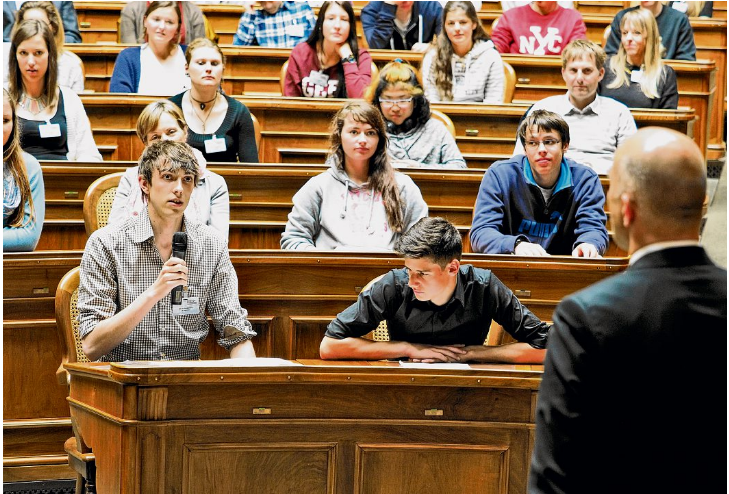
Die Mittelschüler forderten den Bundesrat mit kniffligen Fragen zu Wirtschaft, Gesundheit und Aussenpolitik.

Er selber habe sich in diesem Alter noch kaum für Politik interessiert, gesteht der Mann, der nun im Nationalratssaal auf die Fragen der aufmerksam lauschenden Schüler antwortet. Es ist der Höhepunkt des Anlasses: Charismatisch und smart geht der Freiburger Bundesrat Alain Berset auf Schülerfragen ein, antwortet aus dem Stegreif – mal auf Deutsch, mal auf Französisch. Er erklärt Sachverhalte zu Themen aus Wirtschaft, Gesundheit und Aussenpolitik. Er spricht heikle Dinge an, macht aber auch Spässe. Ein echter Staatsmann eben. Und ein Sympathieträger, wie sich im Anschluss an den einstündigen Gedankenaustausch zeigt. Mehrere Schüler lassen es sich nicht nehmen, ihren Besuch beim Bundesrat auf einem Foto zu verewigen. Auch der Bundesrat verewigt den Besuch. Via Twitter verschickt er ein Bild des vollen Nationalratssaals und schreibt dazu: «Spannender Austausch mit Mittelschülerinnen und -schülern aus dem Kanton Freiburg bei ihrem Besuch im Bundeshaus.» Eine rundum gelungene Schulreise. Nicht nur für die Gäste, sondern auch für die Gastgeber, die nun alle gemeinsam zum Imbiss in die Galerie des Alpes schreiten. So viel Politik macht schliesslich hungrig.