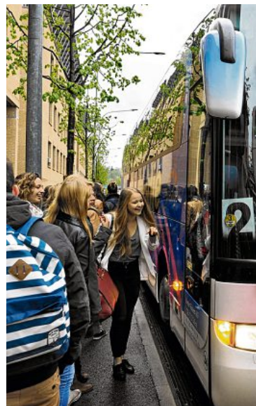
Bitte alle einsteigen!