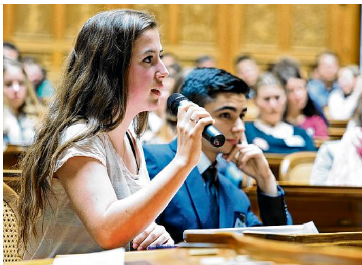
Highlight: Einmal dem Bundesrat eine Frage stellen.