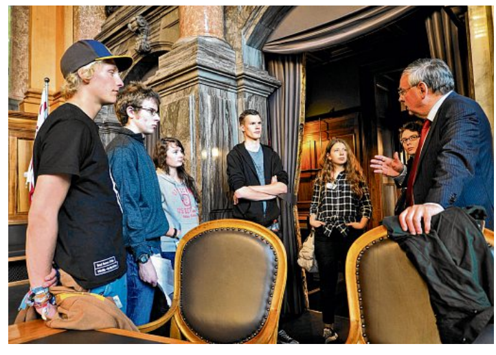
Jean-François Rime diskutiert über das politische System.