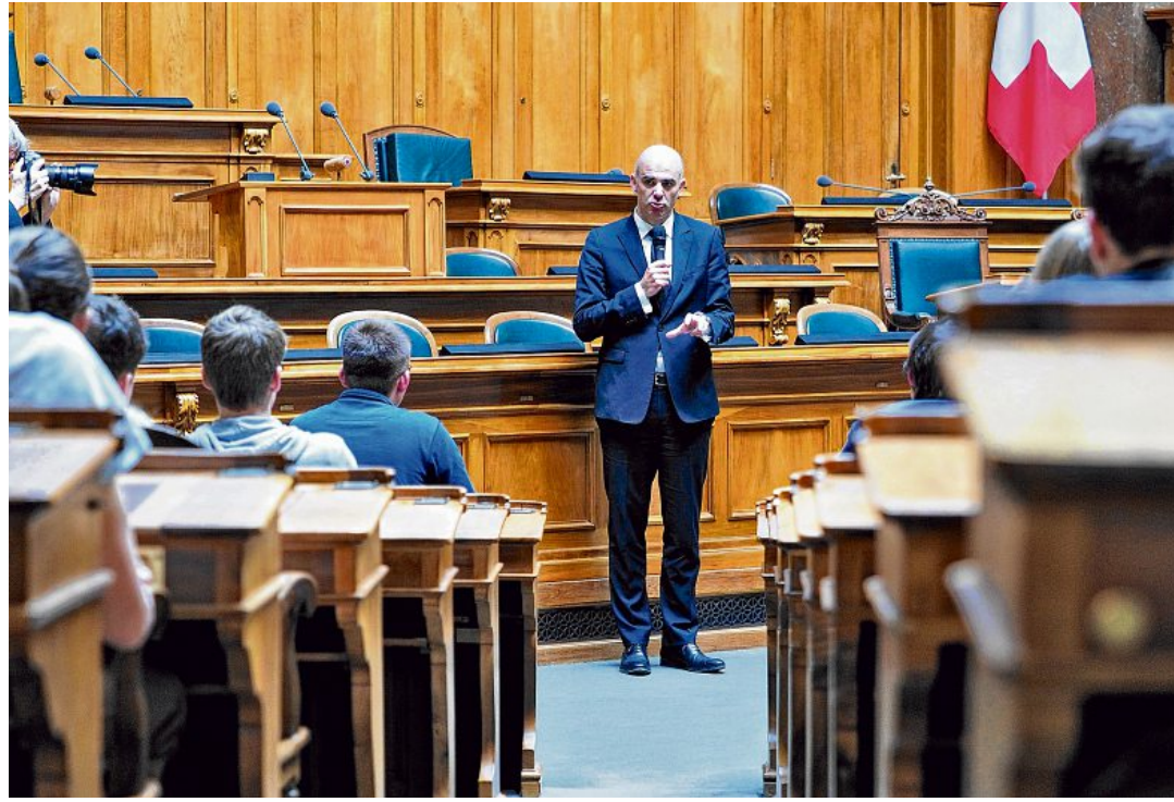
Bundesrat Alain Berset ging offen auf die Schülerfragen ein und machte sogar Spässe.

Kollegen das Bundeshaus in Bern besucht. Dort trafen sie auf die Freiburger Bundesparlamentarier sämtlicher Couleur. Diese zeigten ihnen Ausflugs nach Bern war eine Diskussionsrunde mit dem Freiburger SP-Bundesrat Alain Berset . Dieser zeigte sich volksnah und offen.