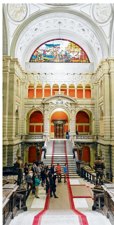
Die schicke Eingangshalle.